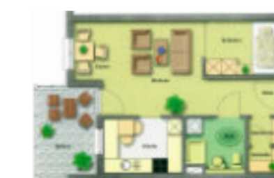
Exemplarischer Grundriss einer 1,5-Zimmer-Wohnung

Seniorenwohnanlage Umkirch „Am Herren- wäldle“ Snewelinstr. 27 79224 Umkirch ☎ 07665 - 942 270 wal-umkirch@awo-bhe.de